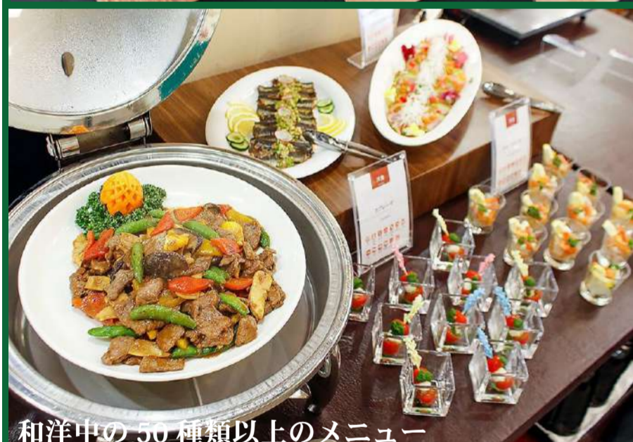
和洋中の50種類以上のメニュー