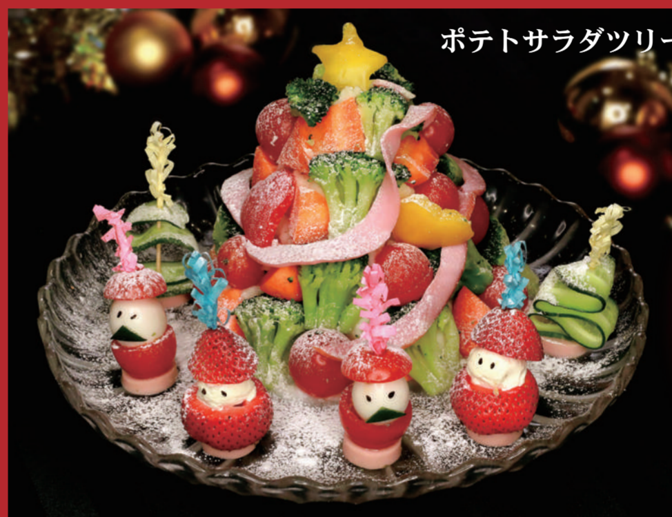
ポテトサラダツリー