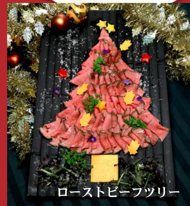
ローストビーフツリー