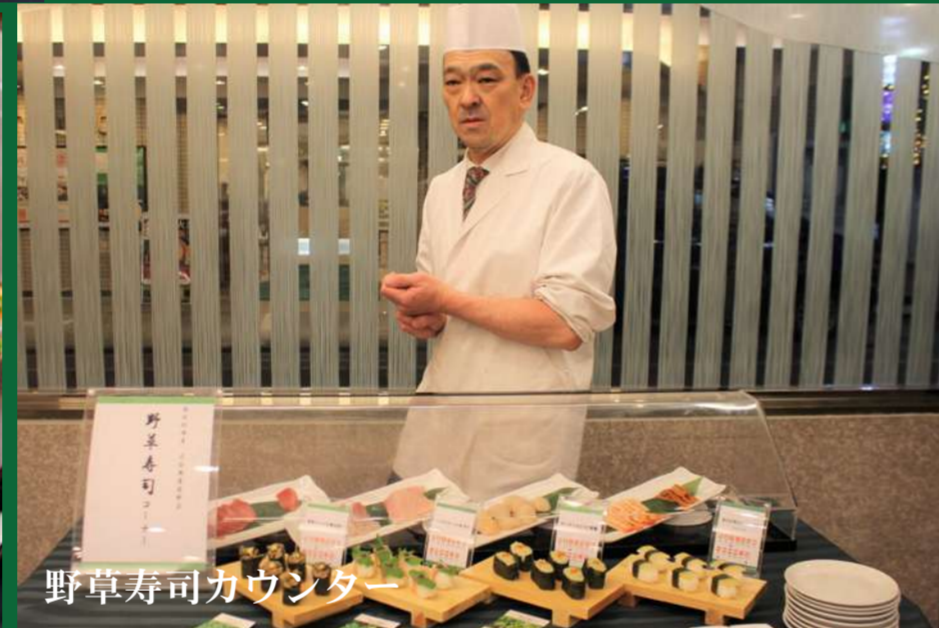
野草寿司カウンター