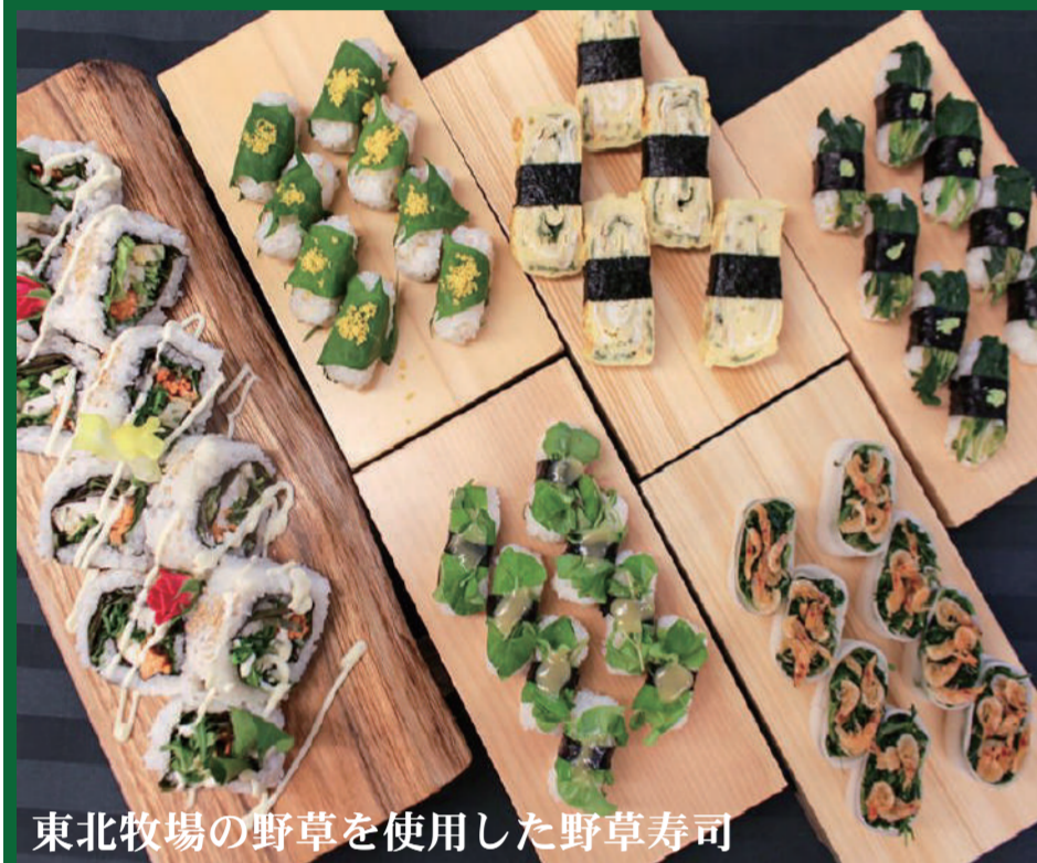
東北牧場の野草を使用した野草寿司