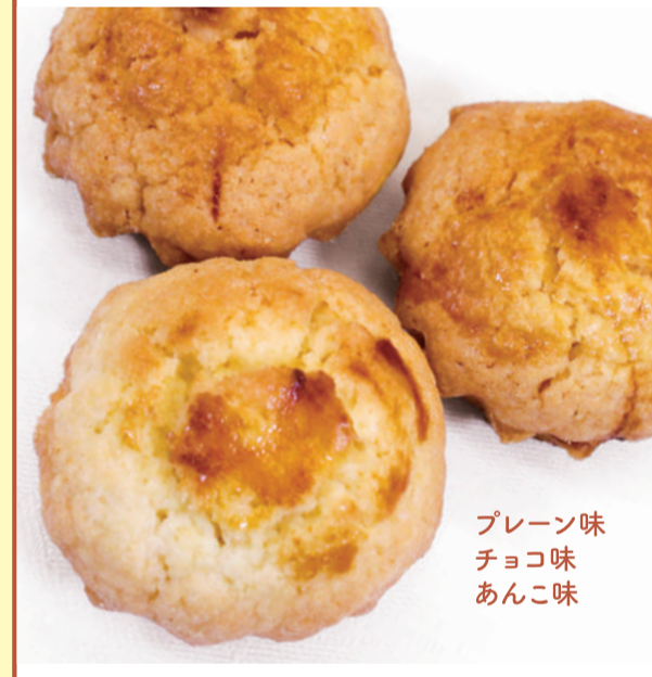
プレーン味 チョコ味 あんこ味