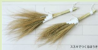
ススキでつくるほうき

《雑草研究所》による 「ススキでつくるほうきづくり」(3名) ・開始時間 13:30 ~ 1時間程度 ・参加費(材料費込) ¥2,500