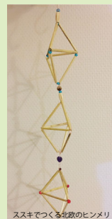
ススキでつくる北政のヒンメリ

《雑草研究所》による 「ススキの茎を使ったヒンメリのクリスマス飾り」(3名) ・開始時間 13:30 ~ 1時間程度 ・参加費(材料費込) ¥2,500 ・申し込み/問合せ zasso.laboratory@gmail.com